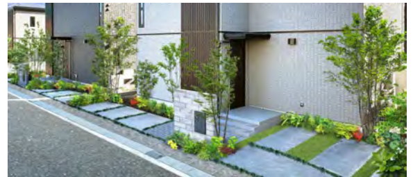
リズム感のある連続した緑の風景