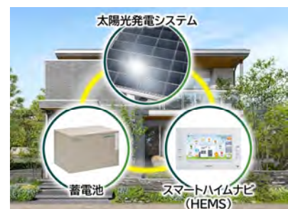
3点セット(PV、蓄電池、HEMS)を全邸搭載

快適な室内環境の確保やカーボンニュートラル社会への貢献を目指し、全邸を『ZEH』仕様※3とします。高い品質管理のもと大半が工場生産される高気密・高断熱の躯体性能をベースに、PV(4kW以上推奨)、蓄電池(4kWh以上※6)、HEMS「スマートハイムナビ」の3点セットを全邸で採用。可能な限り自然エネルギーを活用し、電力価格高騰リスクにも対応するクリーンな暮らしを実現します。