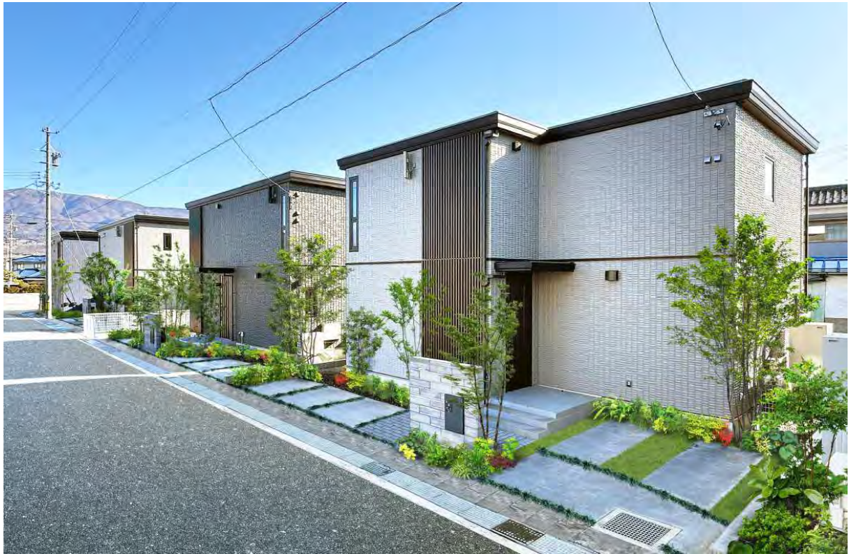
『ユナイテッドハイムパーク松本市村井』のまちなみ※13