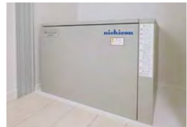
災害後の生活も守る蓄電システム ※2