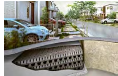
豪雨に備える雨水貯留・浸透槽「クロスウェーブ」

また、停電時でも電気が使えらる蓄電池 ※2 を全邸で採用しています。万が一の停電時も灯りやスマートフォンの充電、冷蔵庫の電源など生活に必要な電力を確保することで、家族の安心を保ち、災害時の在宅避難 ※10 を可能にします。