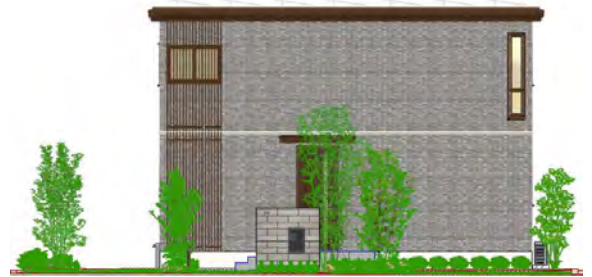
化粧格子をアクセントとしたシンプルモダン外観

さらに区画ごとにシンボルツリーとサブツリー、低木や地被類を適所に配置をし、建物・外構とのバランスを取りながら組み合わせることで、リズム感のある連続した緑の風景をつくりだします。