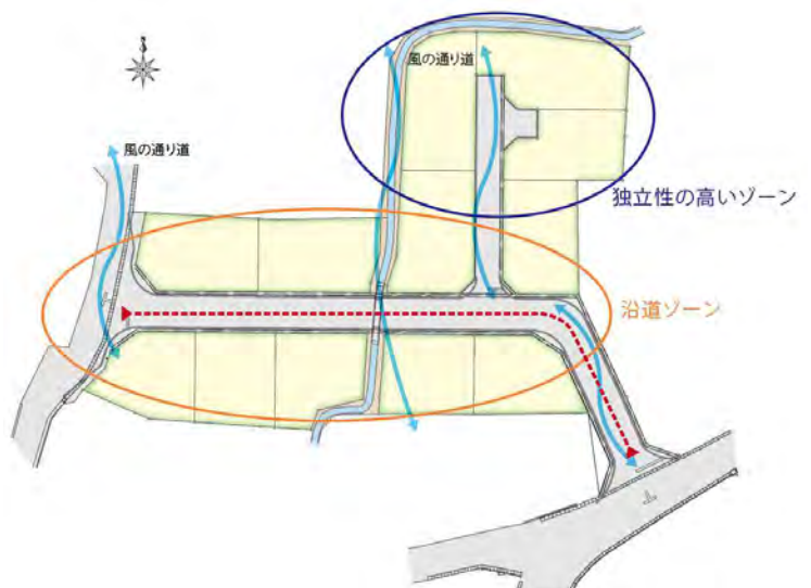
地形を生かした12区画の分譲地

逆L字型の地形を生かした全12区画の分譲地は、自然な街区形状とフラットな地勢を活かしながら、各区画をプランニングしやすく整形に近づけました。美しい景観を育む沿道ゾーンと、通過交通のない落ち着いた独立性の高いゾーンなどで構成。松本市の夏の最多風向は北と南になります。水路と街区内道路、外部道路など、南北にできるスリットが風の通り道となり、心地よい風を運んでくれます※5。