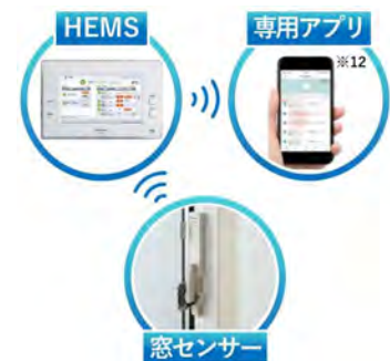
窓施錠解錠開閉見守りシステム

自然災害時の安心だけでなく日常の安心も確保するため、窓施錠解錠開閉見守りシステムを全邸に設置します。警察庁のデータによると、泥棒などの侵入窃盗犯罪数は一戸建てが多く、一番狙われやすいのは窓からの侵入です ※11 。センサーを設置した窓の施錠状態を HEMS モニターでまとめて確認できるほか、外出中に窓が開いた時にはスマートフォン ※12 への通知も行うため、速やかに異常を知ることができます。まち全体で防犯意識を向上させることで、安心して永く暮らせるまちづくりをサポートします。