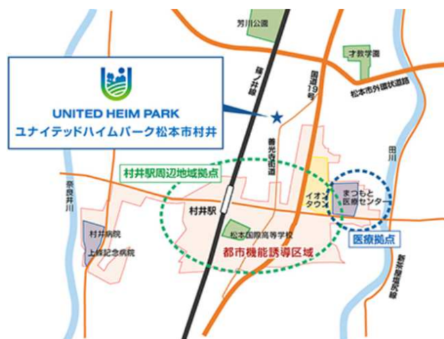
都市機能が充実したエリア

このような未来への期待が高まるエリアで、美しく統一されたまちなみを維持するため、自然な街区形状とフラットな地勢を活かしたランドプランを行い、まちの価値を向上する洗練されたデザインの分譲住宅を建築しました。